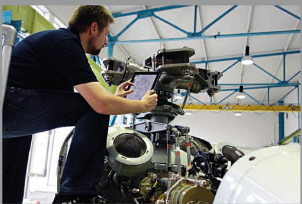
DR-Annotate in der Wartung