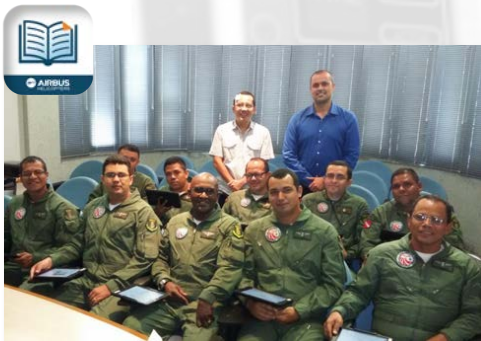
Beispiel Brasilien: AH-Emanuels im Einsatz