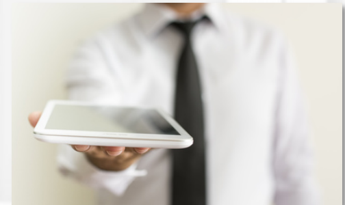
Ausgabe konfigurierter Leihgeräte